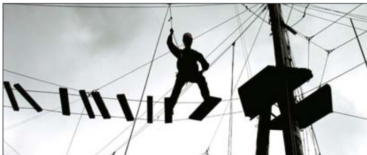
Höhenangst sollte nicht unbedingt haben, wer sich in einen Hochseilgarten traut. Er ist eine der nächsten Anlaufstellen der „Spielzeit“ im Jahr 2008.

Radloffs Rolle gleicht der eines Kindergärtners. Er versorgt das Kind im Manne, hält es bei Laune. Vormehr als dreihundert Jahren hätte er einem Kindskopf wie Isaac Newton die Steine am Meeresstrand gereicht. Die Zeiten haben sich geändert: Heutzutage bietet er Junggebliebenen „Spielzeiten“ mit moderneren Spielzeugen – eine Not-Tür aus der grauen Erwachsenen-Realität. Wie lautet noch das abenteuerliche Motto: Alltag raus und rein in die „Spielzeit“. Ronny Thurow