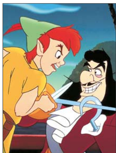
Moderner Pan: Hugh Grant als Will im Film „About a boy“.

Pan lebt auf einer Fantasie-Insel namens „Nimmerland“, ist Anführer einer Bande, den „verlorenen Jungs“. Mit einer Fee namens „Tinkerbell“ geht er eines Nachts nach London und nimmt die Geschwister