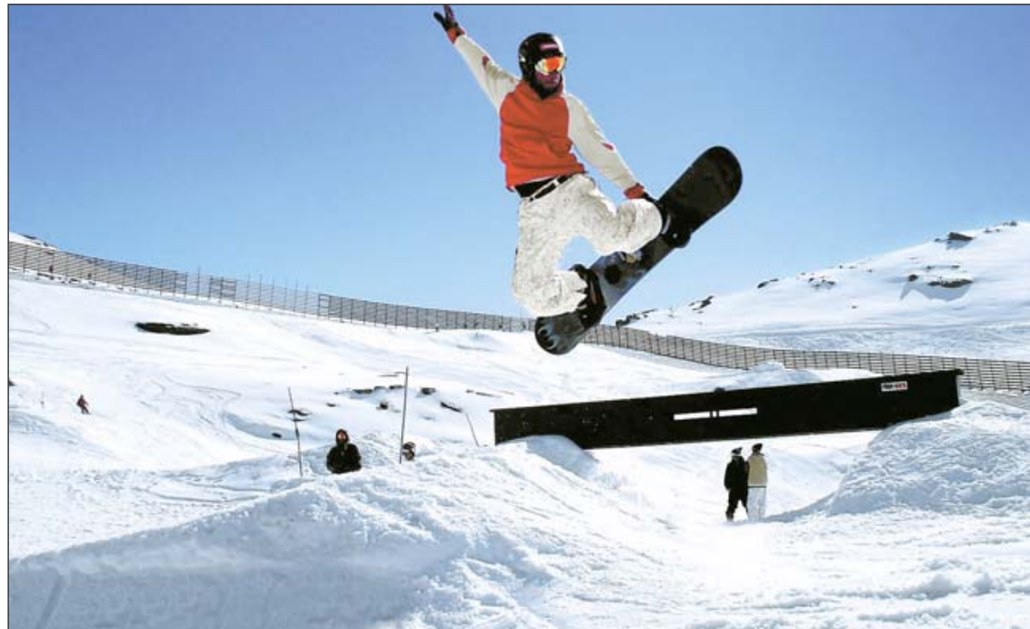
Ein Snowboard ist ein tolles Spielzeug, mit dem sich das Kind im Manne nach Herzenslust austoben kann: Springen, Fahren, Luft-Figuren – nicht ist unmöglich.

Spielen ist nicht nur Kindern vorbehalten. Auch ausgewachsene Mannsbilder wollen sich austoben. Dafür bedienen sie sich freilich nicht mehr der Matchbox-Autos aus Kindertagen. Große Kindsköpfe setzen im 21. Jahrhundert auf Motorräder, Snowboards, Wakeboards, Fallschirme. Aber wo und wie mit ihnen spielen? Eine Engelsbrander Agentur bietet dem Kind im Manne einen Abenteuerspielplatz: die Event-Serie namens „Spielzeit“.