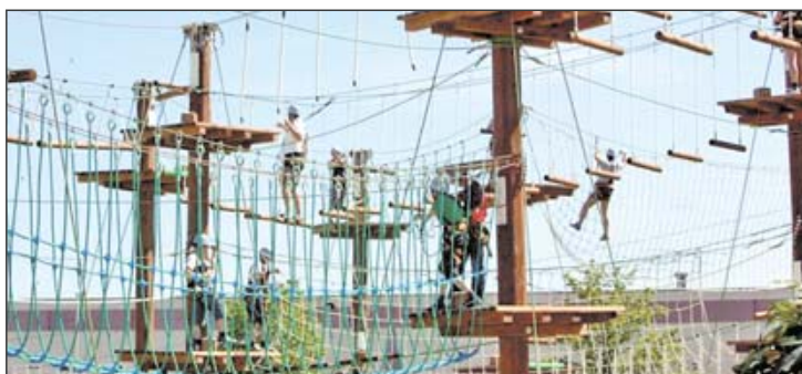
Höhenangst sollte nicht unbedingt haben, wer sich in einen Hochseilgarten traut. Er ist eine der nächsten Anlaufstellen der „Spielzeit“ im Jahr 2008.